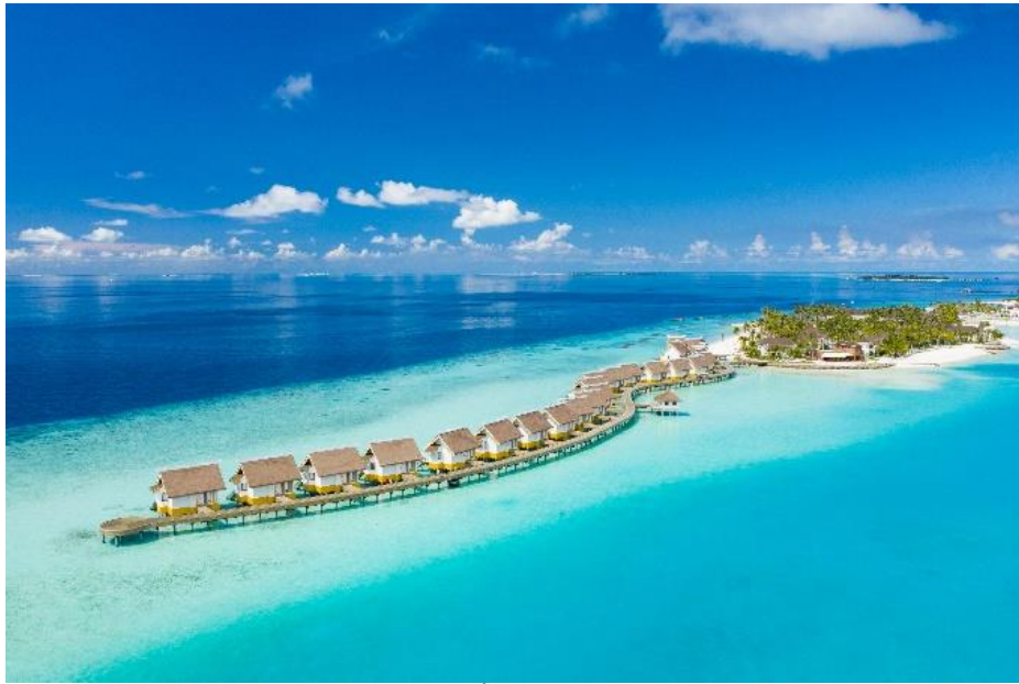
ทราย ลากูน มัลดีฟส์ (SAii Lagoon Maldives) รีสอร์ทชั้นนำเปิดให้บริการในปี 2562 ภายในโครงการครอสไรด์ส์ มัลดีฟส์

การเปิดตัวรีสอร์ทแบรนด์ “SAii” สองแห่งแรกของไทยนั้น เป็นส่วนหนึ่งของแผนการเติบโตที่น่าตื่นตาตื่นใจของ บริษัท เอส โฮเทล แอนด์ รีสอร์ท จำกัด (มหาชน) (S Hotels & Resorts Public Company Limited: SHR) บริษัทในเครือของ บริษัท สิงห์ เอสเตท จำกัด (มหาชน) โดยหัวใจสำคัญของกลยุทธ์การเติบโตของ SHR คือการปั้นแบรนด์ไลฟ์สไตล์ใหม่ ๆ ได้แก่ “SAii” (ทราย) และ “nābor” (เนบอร์) แปรนติโรงแรมและรีสอร์ทระดับกลางที่คุณภาพเทียบเท่าระดับลักซ์ชวรี (Luxury Midscale) ใหม่ล่าสุด ปัจจุบัน SHR ประกอบด้วยโรงแรมและรีสอร์ท 39 แห่งใน 3 ทวีป รวมกว่า 4,600 ห้อง