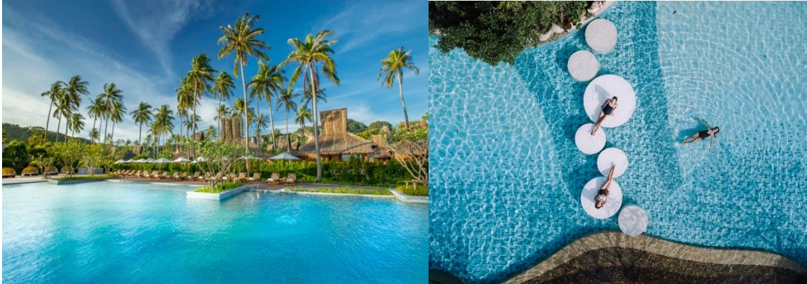
“ทราย พีพี ไอสแลนด์ วิลเลจ” นำเสนอการประสบการณ์และกิจกรรมที่เป็นมิตรกับสิ่งแวดล้อม ดูปัจจัย “SAiiiders” (ทรายแลนด์เดอร์) โดยเฉพาะ

รีสอร์ท SAii ทั้ง 2 แห่งในประเทศไทยจะดึงดูด “InSAiiiders” (อินทรายเดอร์) หรือ สาวกแบรนด์ “SAii” ที่มีหัวใจนักสำรวจ และรักในการแสวงหาประสบการณ์ใหม่ๆ และการค้นพบอันน่าตื่นตาตื่นใจ สอดคล้องกับพฤติกรรมนักเดินทางรุ่นใหม่ยุคดิจิทัล